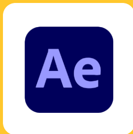
Adobe After Effects